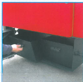
Entschmutzung – kompakt und einfach